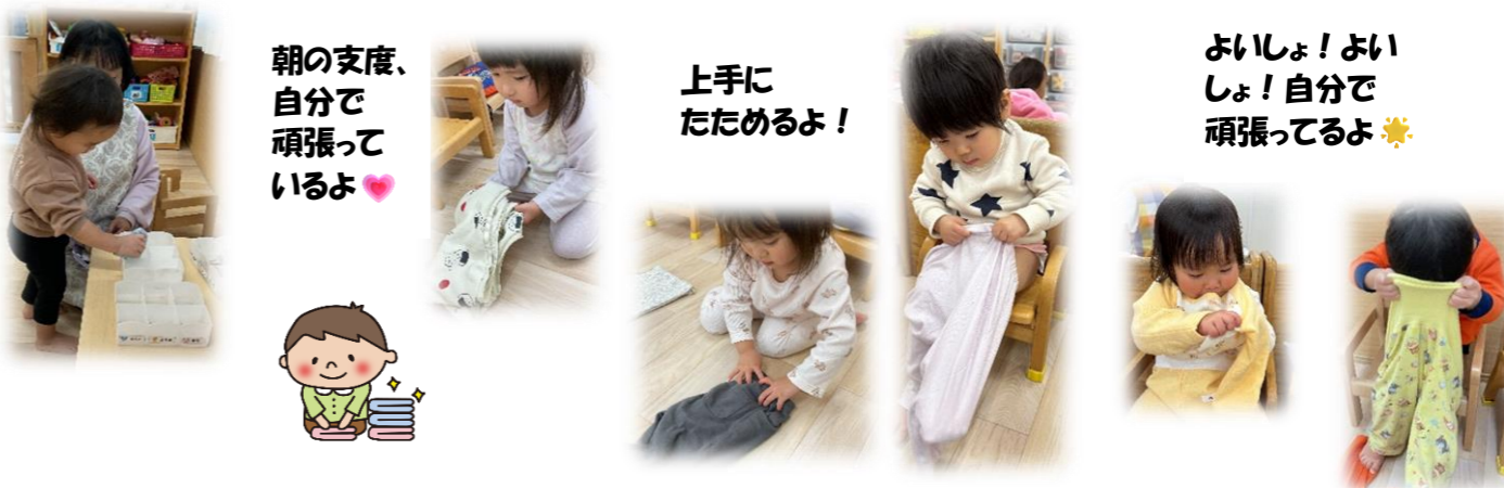
朝の支度、自分で頑張っているよ♡

最近少しずつ色々な事が出来るようになり、ちょっぴりお兄ちゃんお姉ちゃんになったあひる組さん！！朝のお支度や、着替え、洋服のおたたみも、先生と一緒に頑張っています。靴も頑張って履いていますよ。自分で出来る事が増えて子どもたちも嬉しそうです♡